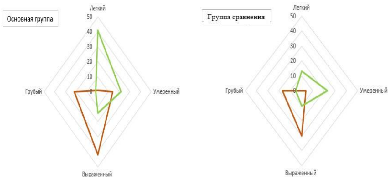
Рисунок 4 - Погрупповое распределение пациентов по степени пареза на момент включения и по окончании реабилитационного курса.

менее 50% от максимального балла (менее 33 баллов), выраженным - 50-70% (от 34 до 46 баллов), умеренным - 71-89% (от 47 до 56 баллов), легким парезом - 90-99% (от 57 до 65 баллов) (рисунок 4).