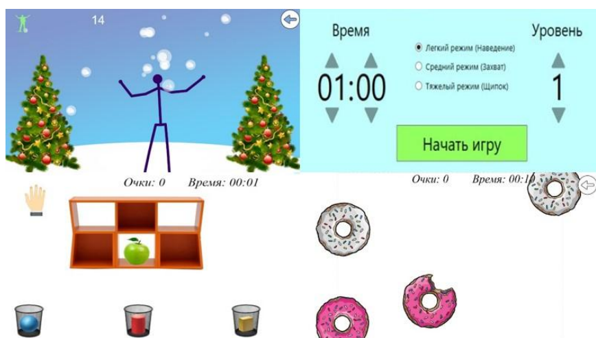
Рисунок 2 - Упражнения в игровой форме в условиях виртуальной реальности.

Программная часть программно-аппаратного комплекса представлена специально изготовленным для медицинских целей программным обеспечением ("СтендАп Инновации", г. Челябинск). Оценка функционального статуса пациентов производилась на момент включения в исследование (до начала реабилитационных мероприятий на 2-3 сутки от начала инсульта) и по окончании реабилитационного курса (12-13 сутки инсульта).